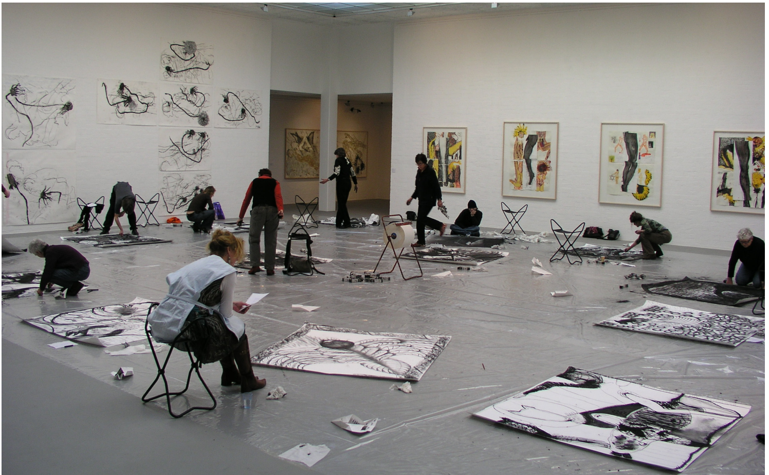
Kunstbeoefenaars tijdens een masterclass van Frank van Hemert.