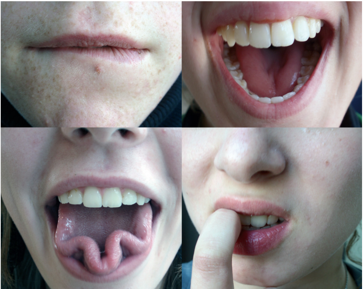
Young state of the union.